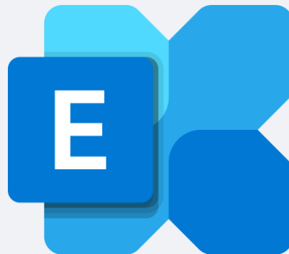
Exchange Server SE